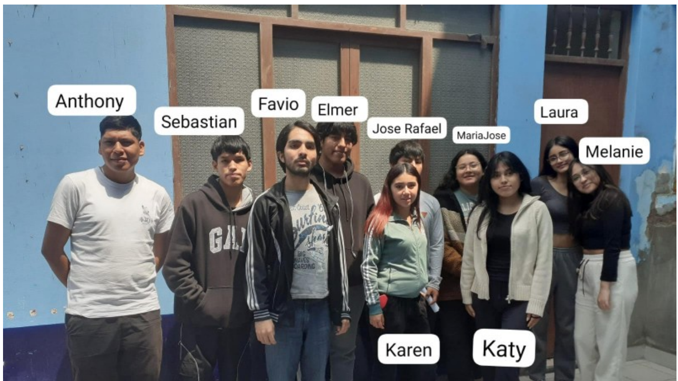
Une partie des étudiants parrainés